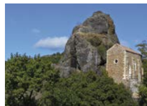
Site de la Roche Chérie

Vous rentrerez ensuite dans un pâturage typique du Coiron, dans lequel vous resterez bien sur la gauche en suivant le balisage.