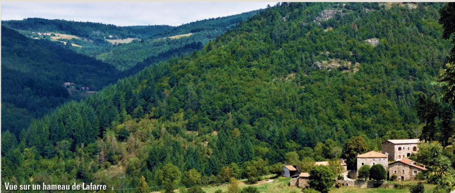
Vue sur un hameau de Lafarre